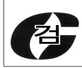
그림 3.6.2.1 합격표시

3.6.2.1.1 합격표시의 크기는 가로 30 mm , 세로 30 mm로 한다.