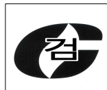
그림 3.6.2.1 합격표시