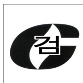
그림 3.6.2.1 합격표시