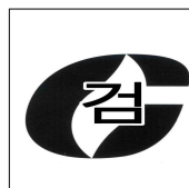
그림 3.6.2.1 합격표시

3.6.2.1.1 합격표시의 크기는 가로 30 mm, 세로 30 mm로 한다.