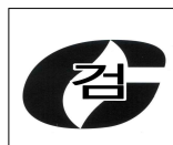
그림 3.6.2.1 합격표시