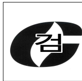
그림 3.6.2.1 합격표시

3.6.2.2 합격표시의 크기는 가로 30 mm, 세로 30 mm로 한다.