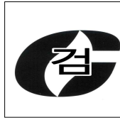
그림 3.6.2.1 합격표시

3.6.2.1.1 합격표시의 크기는 가로 30 mm , 세로 30 mm로 한다.