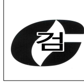
그림 3.9.2.1 합격표시

3.9.2.1.1 합격표시 크기는 가로 20 mm , 세로 16 mm로 한다.